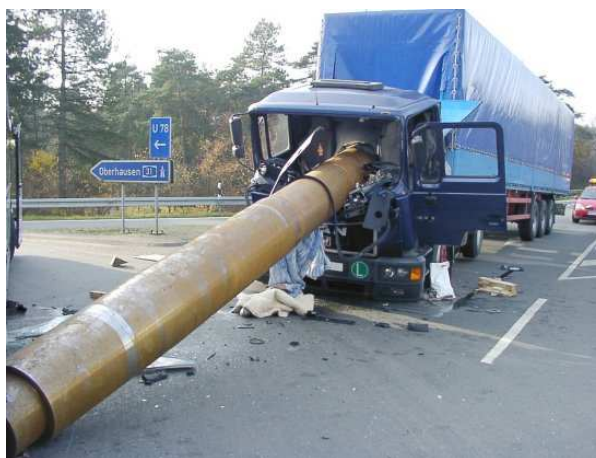
Rys.2.Efekt przemieszczenia się ładunku podczas nagłego hamowania.

W transporcie krajowym sytuacja przedstawia się znacznie gorzej: przede wszystkim brak jakichkolwiek sankcji za przewóz niezabezpieczonego ładunku (brak takiego wykroczenia w taryfikatorze), brak odpowiednich szkoleń wśród kierowców i przewoźników, panujące przekonanie iż "ciężki ładunek nie może się przemieścić, bo ręcznie nie da się tego zrobić" 1 sprzyja sytuacjom w których przewożony ładunek nie jest zabezpieczony. Prowadzi to do bardzo groźnych w skutkach wypadków, jak na rys.2. Skala niebezpieczeństwa jakie jest związane z nieprawidłowo zabezpieczonymi